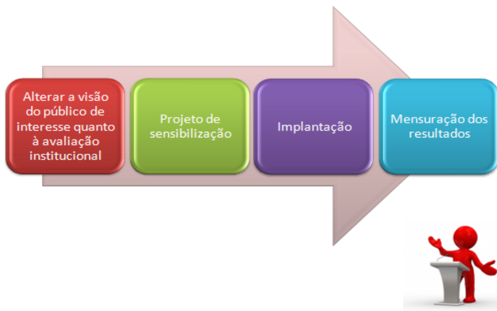
Figura 1 – Etapas a serem seguidas pela CPA no processo de auto avaliação institucional

Cabe destacar que todos os trabalhos desenvolvidos pela CPA possuem metodologia própria, apresentada aos membros da CPA e aos gestores, continuamente buscando a transparência necessária em prol dos resultados verdadeiros e condizentes com a realidade da instituição. O modelo de avaliação aplicado pela CPA se apoia nos fundamentos apresentados na figura 2.