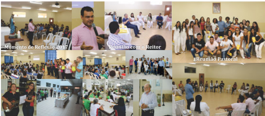
Momento de Reflexão 2017