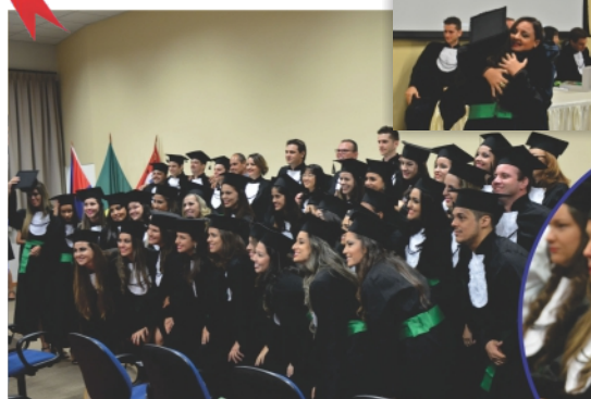
Fisioterapia - 18.12.2015