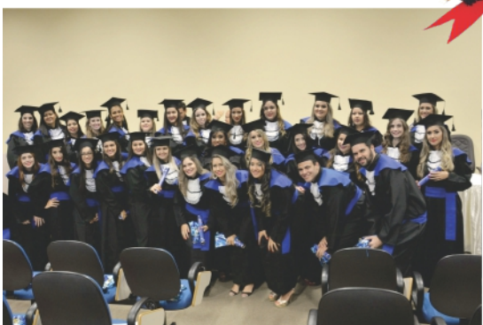
Administração - 16.12.2015