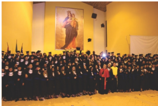
Engenharia Civil, Engenharia de Bioprocessos, Engenharia da Computação, Jogos Digitais e Tecnologia em Desenvolvimento de Sistemas 17.12.2015