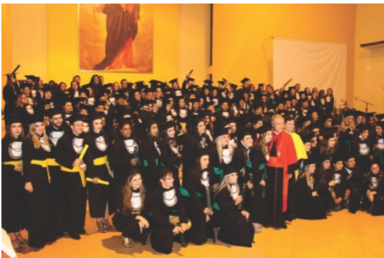
Ciências Biológicas, Educação Física, Enfermagem, Farmácia, Fisioterapia e Nutrição 16.12.2015