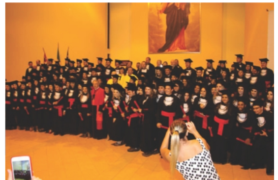
Direito - 18.12.2015