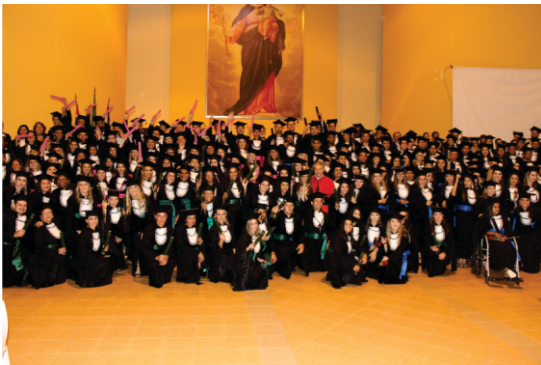
Administração, Ciências Contábeis, Publicidade e Propaganda e Serviço Social 16.12.2014