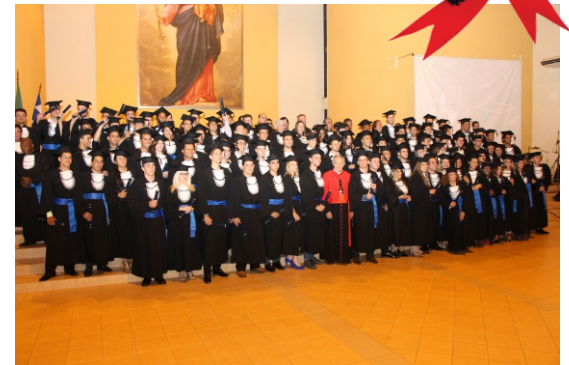
Engenharia da Computação, Mecatrônica, Telecomunicações, Química e Tec. em Desenvolvimento de Sistemas 19.12.2014