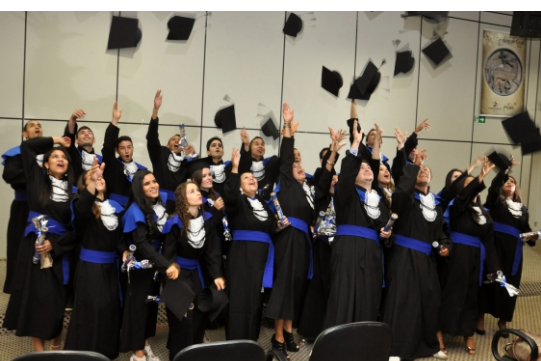
Educação Física - 15.12.2014