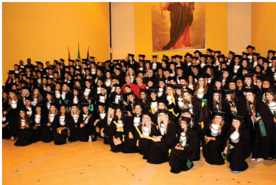
Ciências Biológicas, Educação Física, Enfermagem, Farmácia, Fisioterapia e Nutrição 17.12.2014