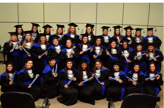
Pedagogia - 8.12.2014