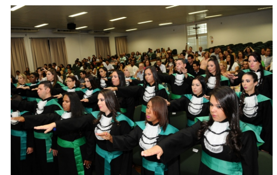
Enfermagem - 18.12.2014