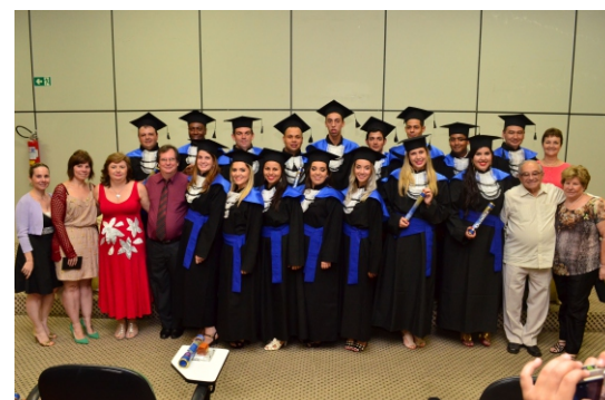
Química - 9.12.2014