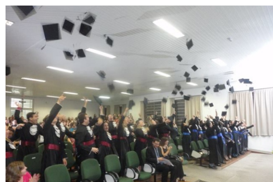
Administração, Ciências Contábeis 17.12.2014