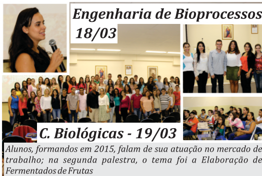
Alunos, formados em 2015, falam de sua atuação no mercado de trabalho; na segunda palestra, o tema foi a Elaboração de Fermentados de Frutas