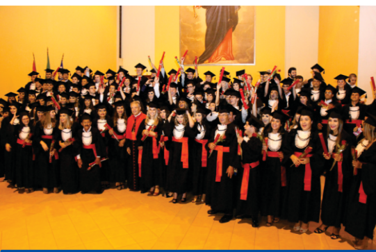
Direito - 5.2.2015