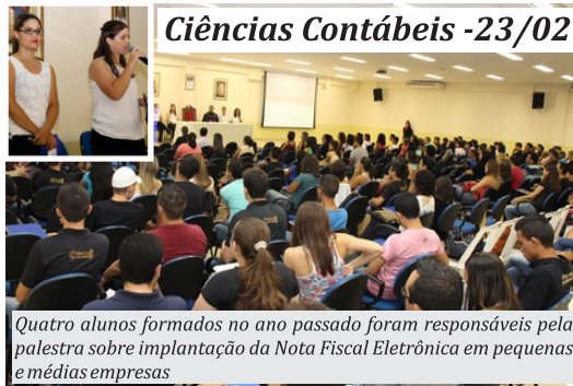
Quatro alunos formados no ano passado foram responsáveis pela palestra sobre implantação da Nota Fiscal Eletrônica em pequenas e médias empresas