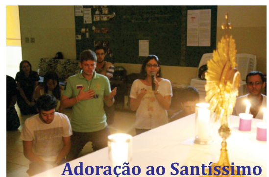
Adoração ao Santíssimo