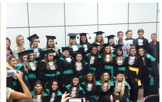
Estética - 9.12.2014