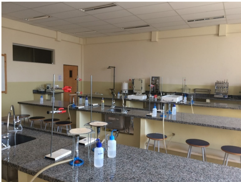
Laboratório de Química e Bioquímica