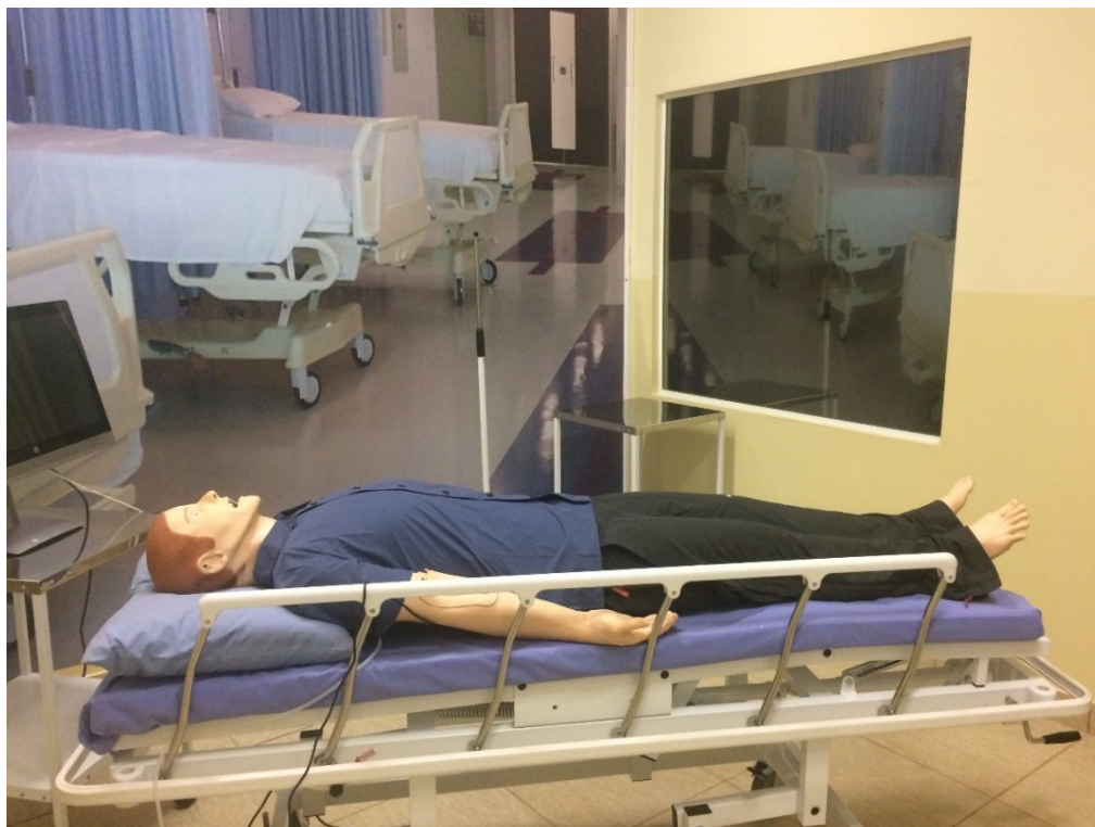
Laboratório de Simulação Realística