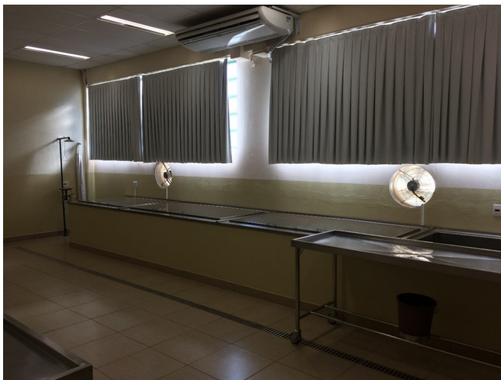
Sala para Dissecação de Peças Anatômicas