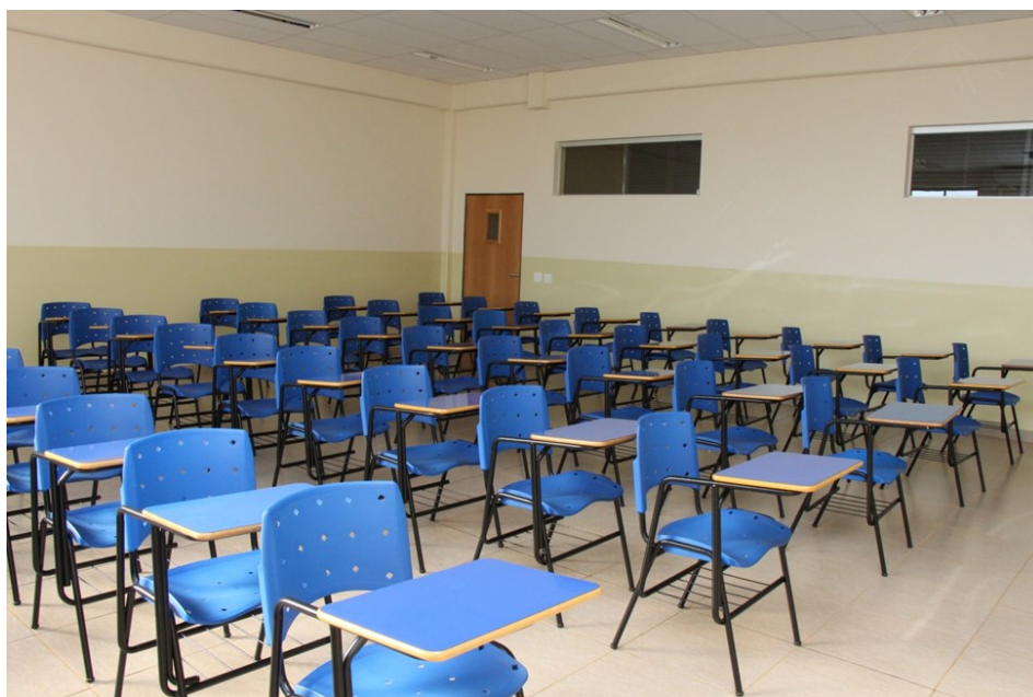
Sala de Aula para grandes grupos