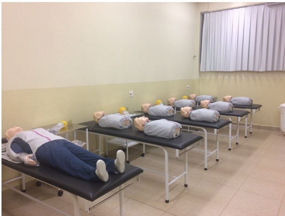
Laboratório de Habilidades Médicas