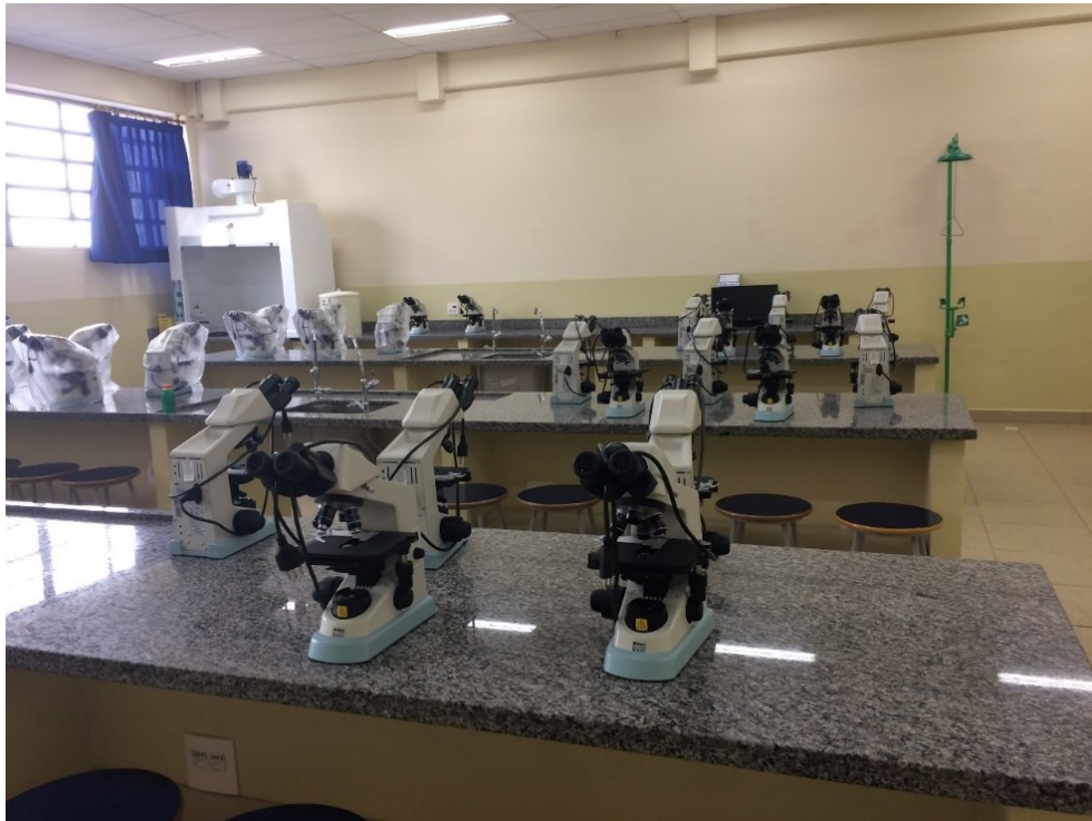
Laboratório de Microscopia