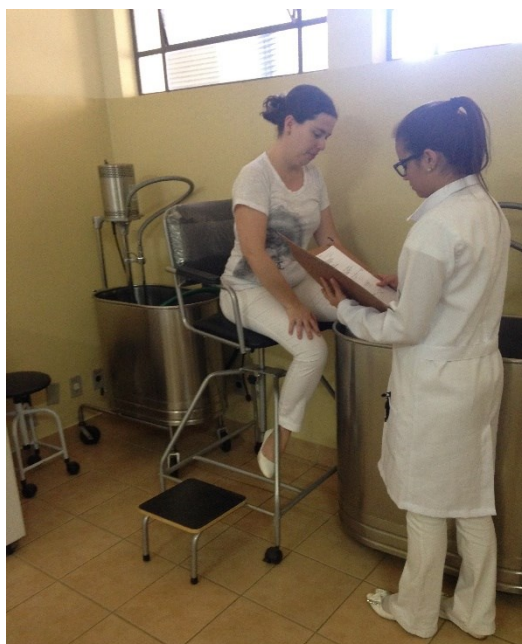
Turbilhão – ortopedia