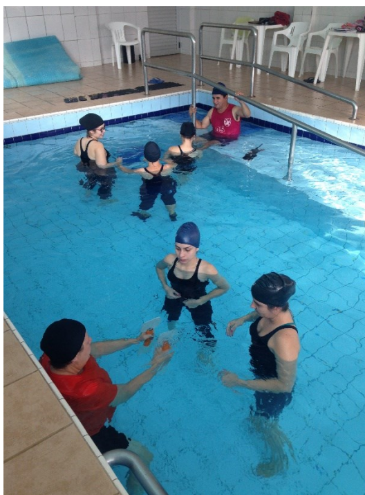
Hidroterapia - geriatria