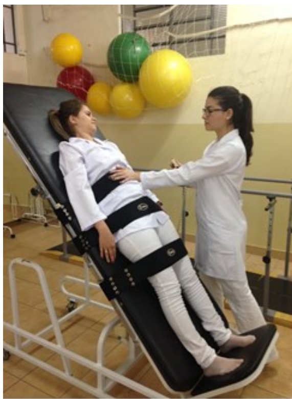
Maca ortostática – neurologia