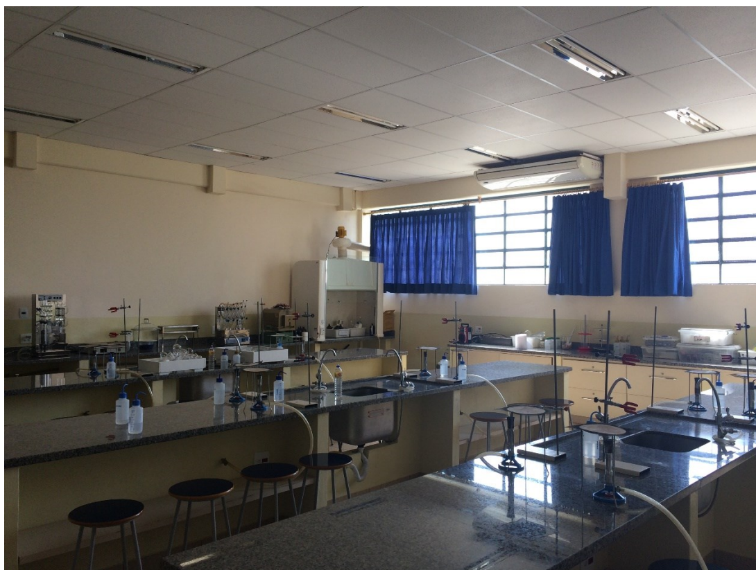
Laboratório de Química e Bioquímica