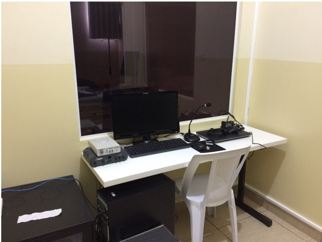
Laboratório de Simulação Realística-Sala de Controle