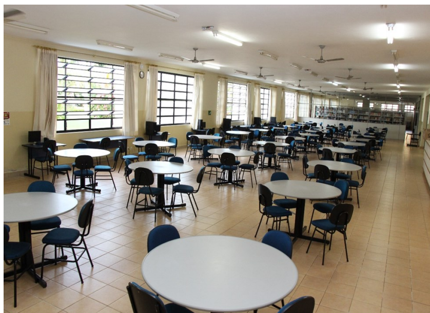
Foto 15 -Espaço para estudo coletivo-Biblioteca

A biblioteca funciona de segunda a sexta, de 7:30h às 22:40min e aos sábados das 8h às 17h.