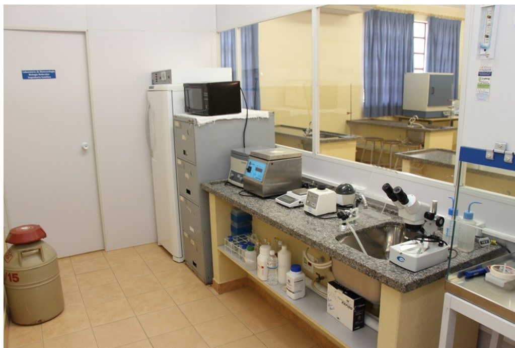
Laboratório de Biologia Molecular