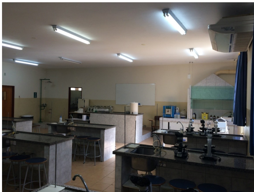
Laboratório Multidisciplinar II