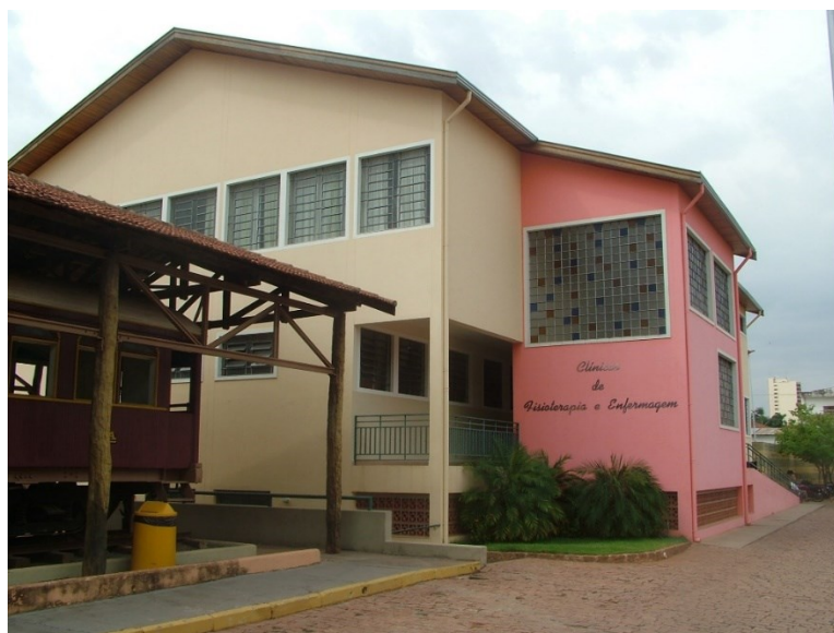
Fachada da Clínica de Fisioterapia

Localiza-se na unidade II no centro da cidade, que além de abrigar atividades e aulas práticas, têm também a função de criar condições para prestar apoio ao acadêmico em suas necessidades de ensino e pesquisa. As Clínicas estão instaladas em uma área de 2.000m 2 , em um prédio com um andar superior, andar térreo e subsolo, com capacidade de atendimento para 200 sessões por semana, funcionando pela manhã e à tarde. Possui ginásio terapêutico, dotado de sala de orientadores e sala de alunos e recepção; hidroterapia e piscina terapêutica, com sanitários, inclusive para deficientes físicos, os quais também contam com elevadores. Toda a Clínica se encontra equipada para atendimentos nos Estágios Supervisionados, dispondo ainda de almoxarifado.