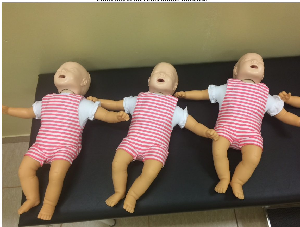
Laboratório de Habilidades Médicas