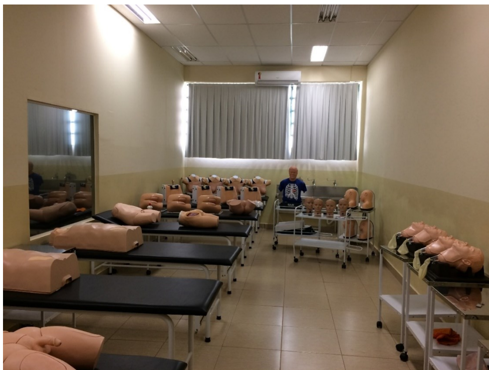
Laboratório de Habilidades Médicas

LABORATÓRIOS DE HABILIDADES MÉDICAS/CLÍNICAS: Os 03 laboratórios de habilidades (150m 2 ) estão equipados com divãs e mesas auxiliares, todos possuem lavatórios e serão montados de acordo com o procedimento proposto, para isso dispomos de laringoscópios, lâminas, espéculos, oftalmoscópio, otoscópio, entre outros.