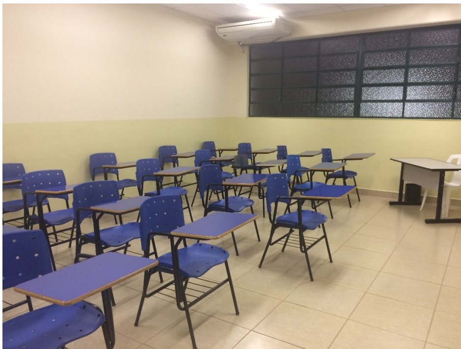
Sala de Aula para pequenos grupos

Cada sala é equipada com condicionador de ar, lousa e cadeiras. Também serão utilizadas para uso de metodologia TBL e conferências, as salas com projetores, num total de 3 salas com capacidade para 60 alunos cada. As salas de aula são equipadas com projetor multimídia e ar-condicionado.