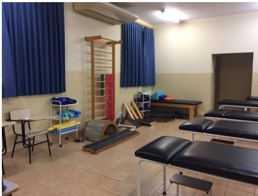
Laboratório I – Recursos terapêuticos - fototermomecanoterapia