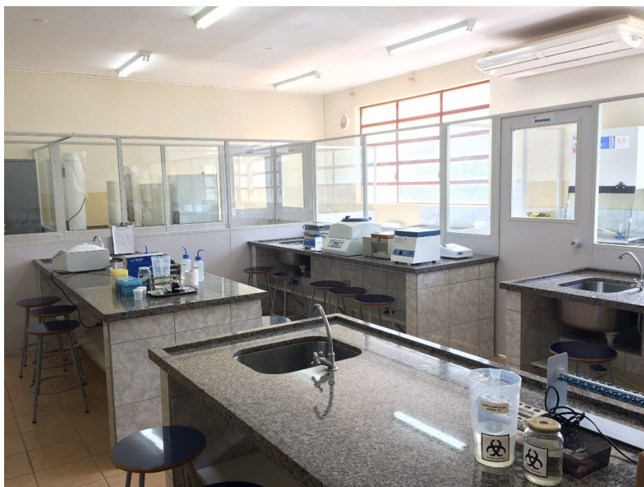
Laboratório Análises Clínicas