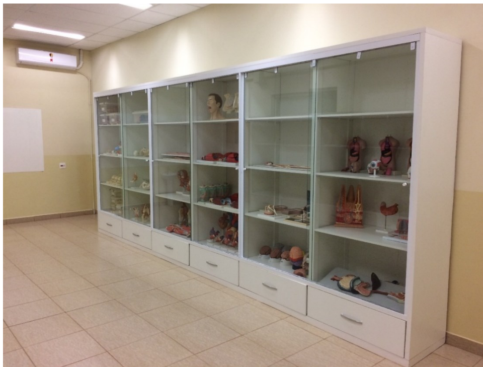
Sala de armazenamento de peças anatômicas