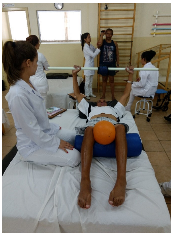
Ginásio terapeutico – barra de ling