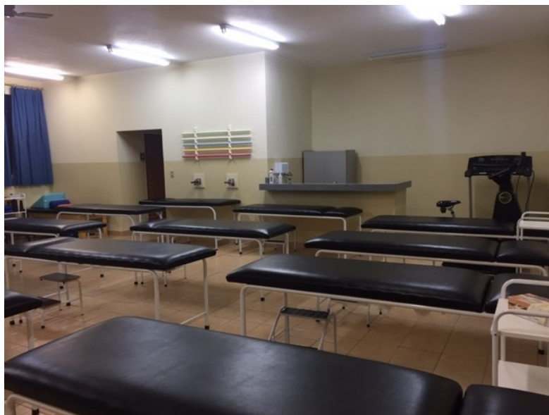
Laboratório I – Recursos terapêuticos - macas

Utilizado para as aulas de recursos terapêuticos que busca o aprendizado teórico-prático de métodos e técnicas que envolvem as disciplinas de fisiologia do exercício, Fototermomecanoterapia, Eletroterapia, Cinesioterapia, Fisioterapia em Ortopedia e Traumatologia, Fisioterapia em Cardiologia, Fisioterapia em Pneumologia, Fisioterapia em Reumatologia, Fisioterapia em Saúde da Mulher e obstetrícia, Fisioterapia em Dermatologia e Estética e Fisioterapia em Lesões do esporte E Fisioterapia em geriatria . Conta com equipamentos como esteira e bicicletas ergométrica, macas, colchonetes, aparelhos de fototermomecanoterapia e eletroterapia, além dos materiais fisioterápicos específicos e de consumo usados para as aulas práticas.