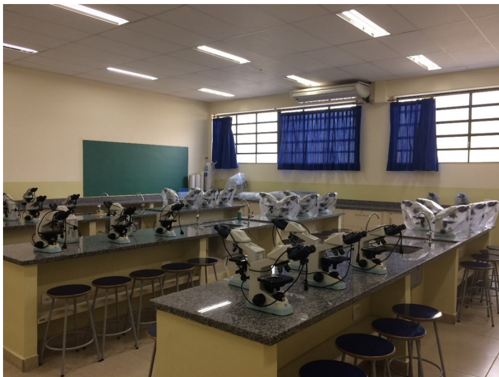
Laboratório de Microscopia