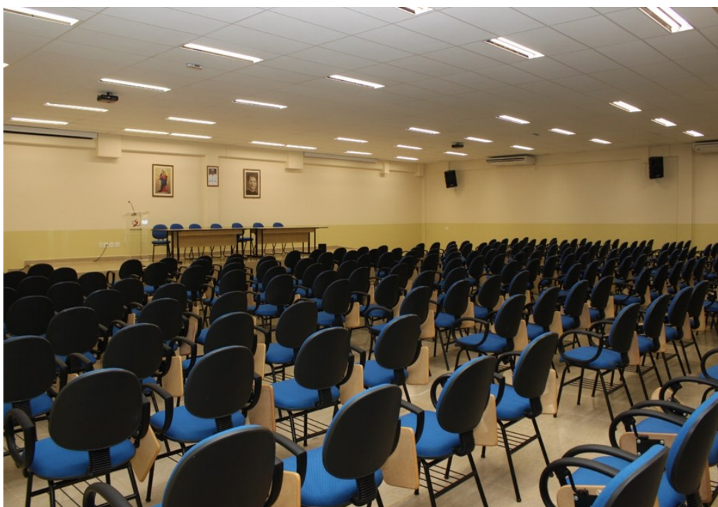
Sala de aula para grandes grupos