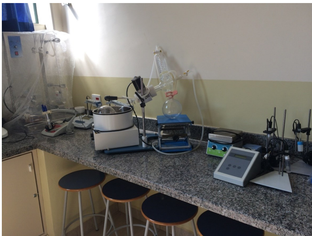
Laboratório de Química e Bioquímica

Laboratório de Microscopia – Bloco C – Sala 13