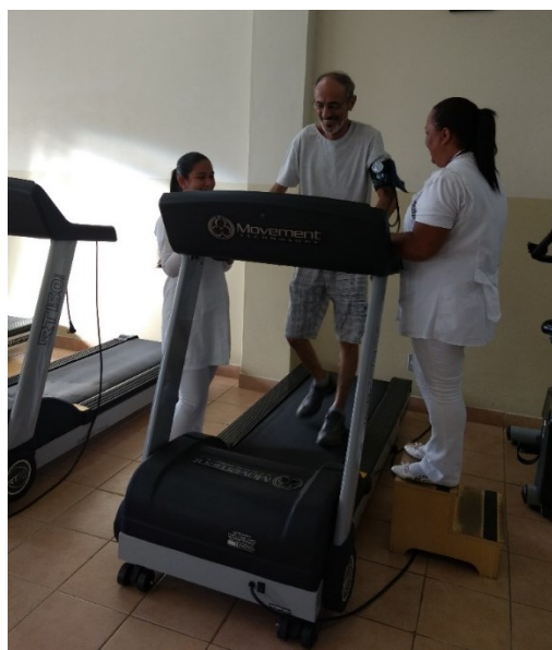
Esteiras – cardiorrespiratório