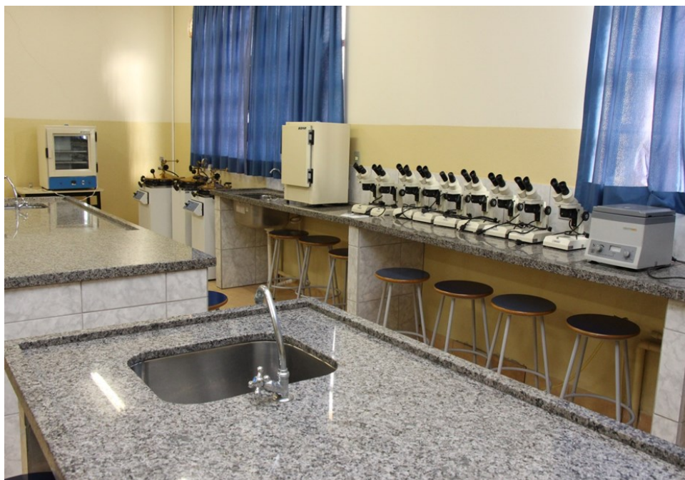
Laboratório Multidisciplinar I