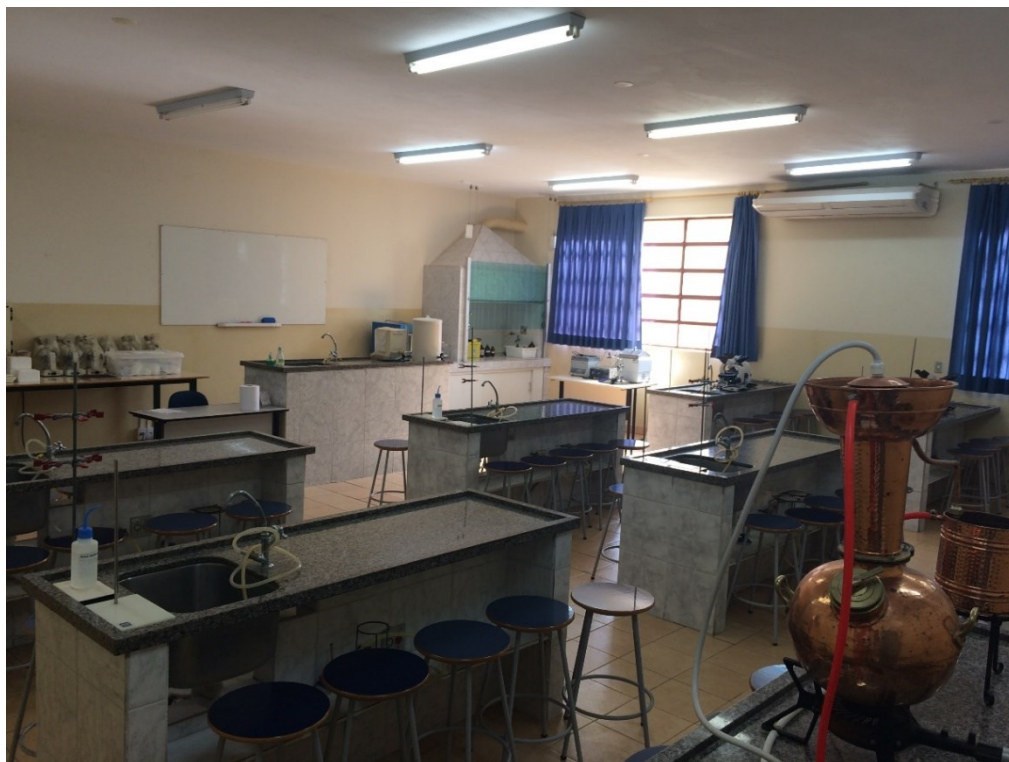
Laboratório de Multidisciplinar II