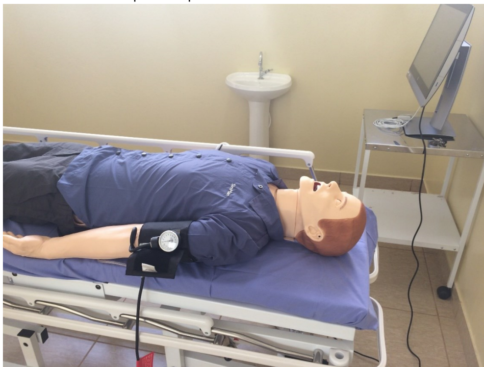
Laboratório de Simulação Realística