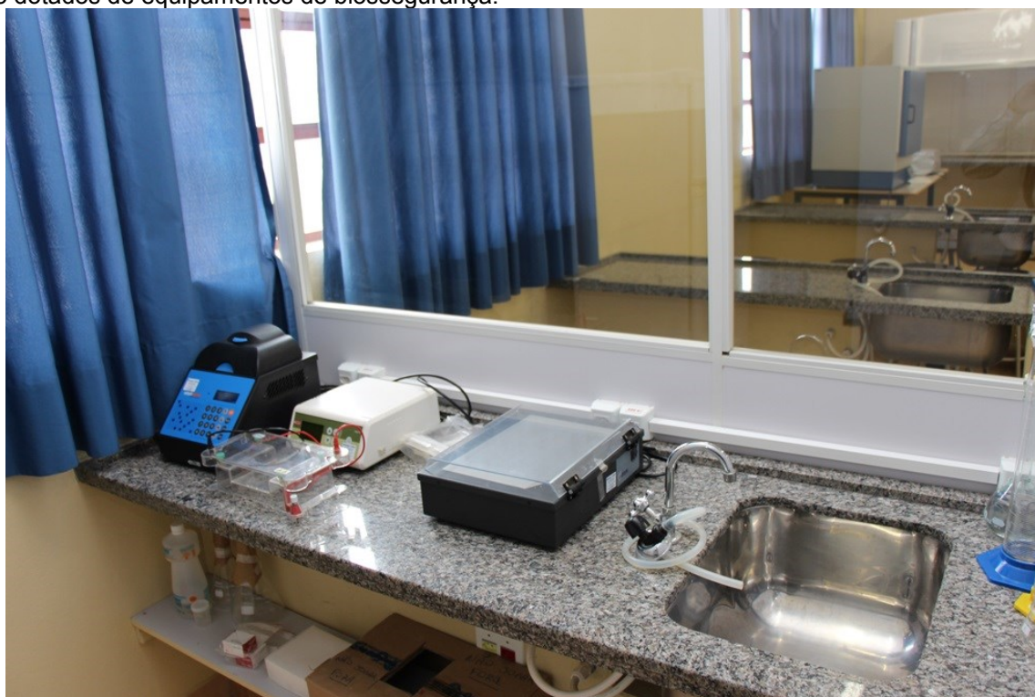
Laboratório de Biologia Molecular

O local apresenta condições ideais de acústica, prevendo isolamento de ruídos externos e boa audição interna, bem como condições adequadas de iluminação (natural e/ou artificial) e ventilação. Os revestimentos de piso e parede deverão possibilitar limpeza adequada. O laboratório, sob orientação docente, deverá ser destinado ao estudo prático integrado da morfologia, fisiologia e patologia humanas, oferecendo ao aluno uma visão multidisciplinar. Desta forma o estudante obterá conhecimentos anatômico e funcional, macro, micro e de interpretação de imagens de exames (radiografias, tomografias computadorizadas, ressonância magnética, ultrassonografias e densitometria óssea), habilitando-o para as situações problemas dos módulos educacionais temáticos. Assim as atividades práticas serão desenvolvidas com o objetivo de habilitar e facilitar a compreensão das sessões tutoriais. Os laboratórios estão dotados de equipamentos de biossegurança.