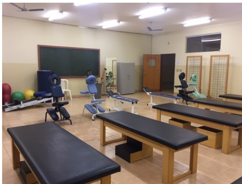
Laboratório II – Recursos terapêuticos – massagem e terapias manuais

Capacidade de Atendimento: 30 alunos -- Turno de Funcionamento: Manhã e Noite