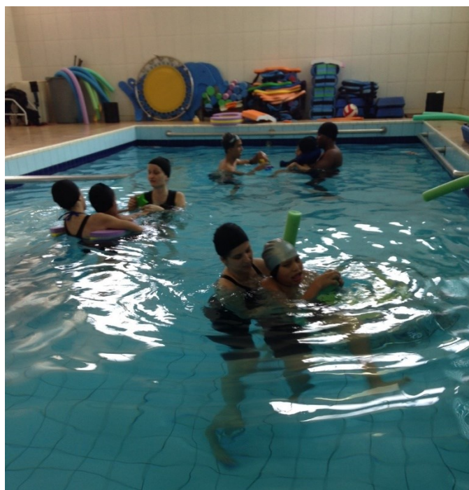
Hidroterapia – neurologia