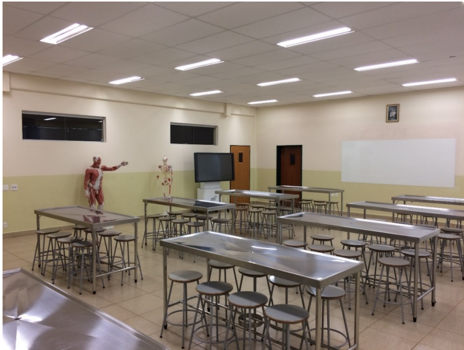
Laboratório de Anatomia-Visão lateral