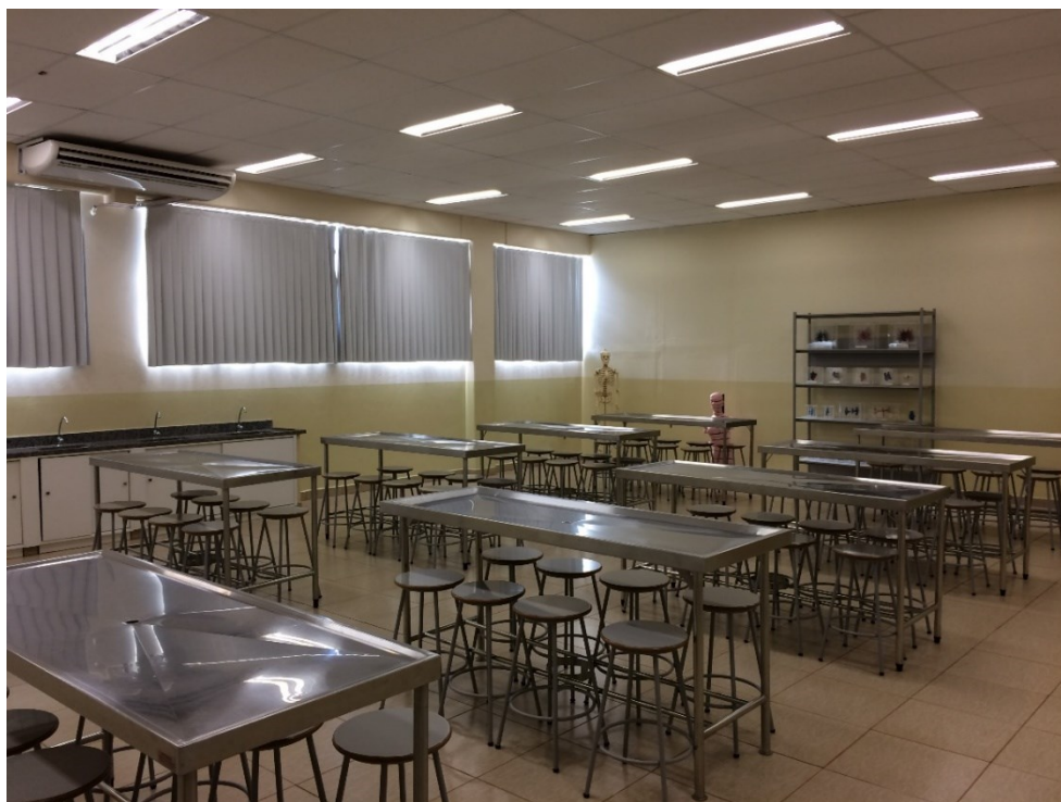
Laboratório de Anatomia-Visão Frontal