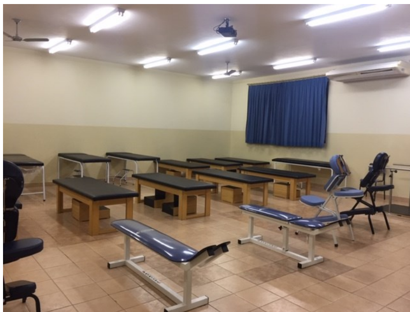
Laboratório II – Recursos terapêuticos - macas

Para atividades práticas das disciplinas de Cinesiologia, BMTACF, Massoterapia, Terapia Manuais, Fisioterapia em Neurologia, Fisioterapia em Pediatria, Fisioterapia em Geriatria, Prótese e órtese e Fisioterapia em Ergonomia e do Trabalho. Conta com matérias como: macas, colchonetes, espelhos, barras paralelas, espaldar, simetrógrafos, bolas, rolos, muletas e bengalas além dos materiais fisioterápicos específicos e de consumo usados para as aulas práticas.