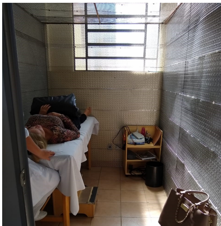
Box com gaiola de Faraday – eletroterapia