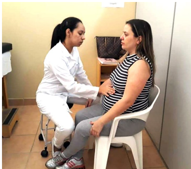
Atendimento – obstetrícia